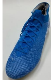
「Viruguard」を使用した製品例